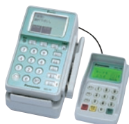
Panasonic製 (ZEC-15) 110(W)×166(D)×118(H)