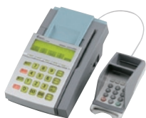
オムロン製 (CATS240) 139.5(W)×246.5(D)×84(H)